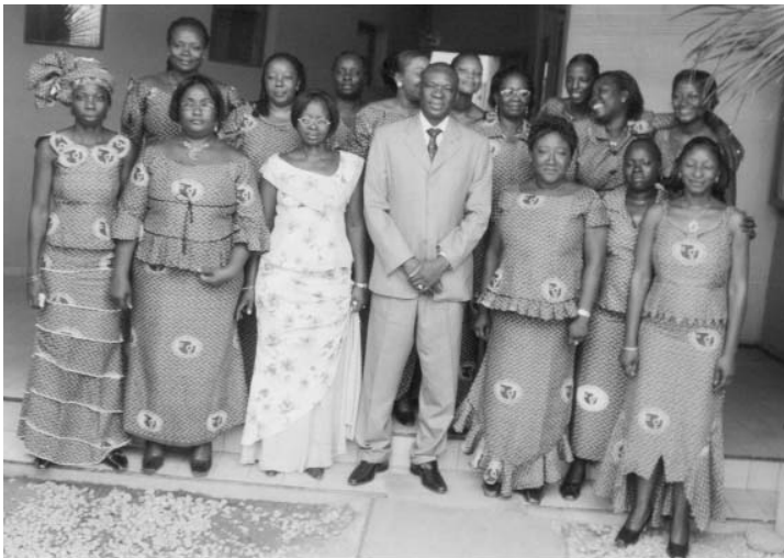
Photo souvenir à l'occasion de la commémoration du 8 mars 2007