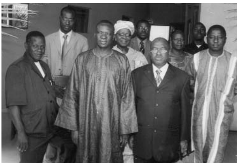
Photo de famille de la délégation malienne et quelques membres du staff du CSC