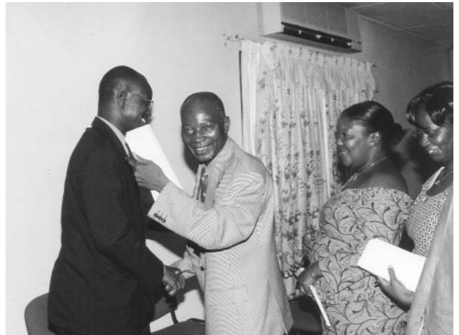
Chaque poignée de mains entre le SG entrant (veste noire) et l'intérimaire (veste grise)